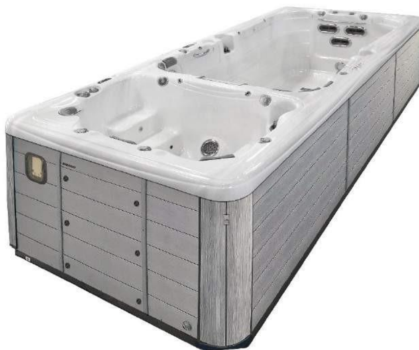
Modèle de jupe présente sur AQUEX 19 ( idem pour AQUEX 13 et 17)