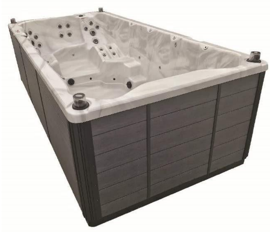
Modèle de jupe présente sur AQUEX 16 (Idem pour AQUEX 12 et 14)