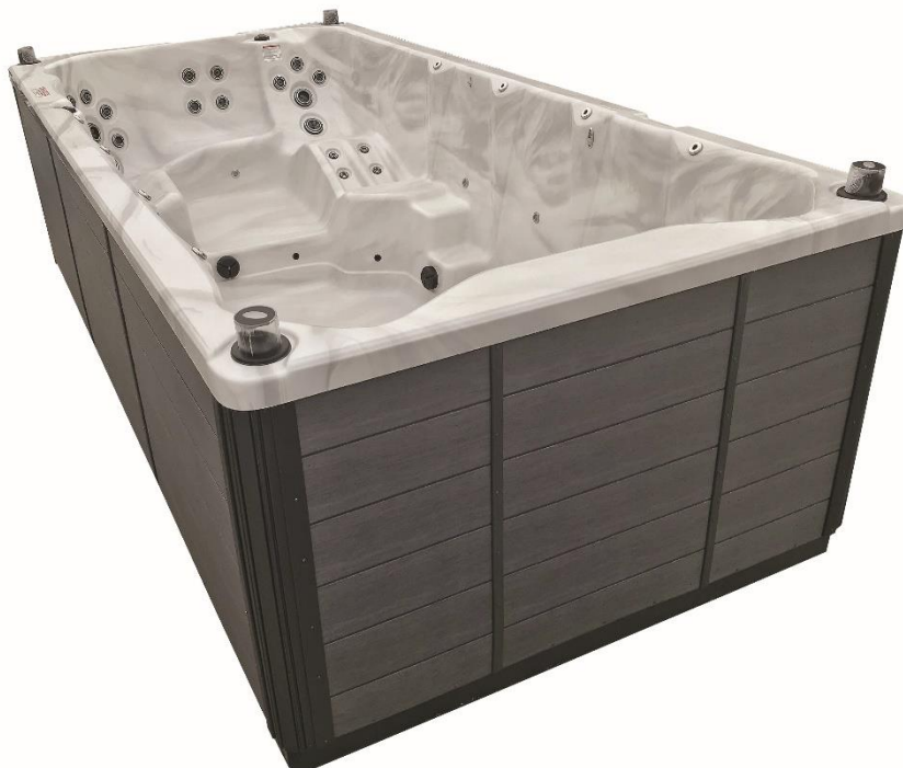
Modèle de jupe présente sur AQUEX 16 (Idem pour AQUEX 12 et 14)