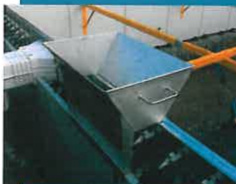
Exemple de goulotte pour coulage.