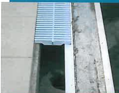
Goulotte de débordement