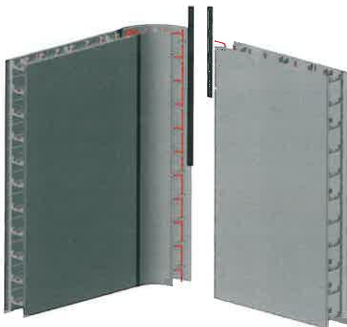
Panneaux STRUCTURA® FEAT