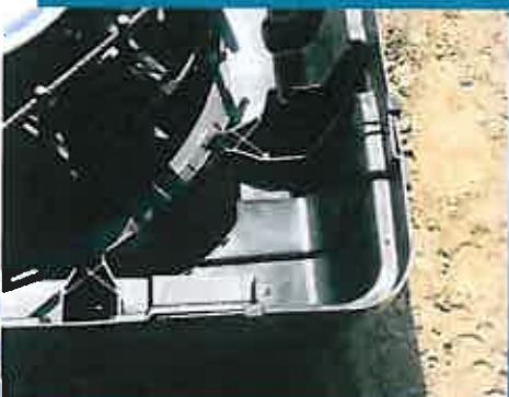
Support de margelle d'angle